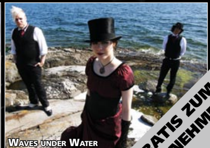
WAVES UNDER WATER