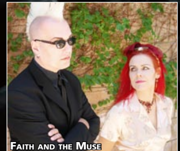
FAITH AND THE MUSE